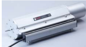
ION-5500 Cuchilla turbina aire ionizado

Cuchilla de aire ionizado de alto rendimiento para la neutralización estática y limpieza de molduras, vidrio, automóviles y otros objetos grandes. La turbina produce un alto volumen de aire que sale de la cuchilla en un rápido flujo laminar.