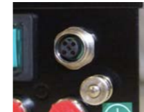
ION-Remote monitor Monitorización remota

La opción de monitorización remota está disponible para la gama de unidades de potencia ION-HP50, ION-HP80 y ION-HPEX. Efectúa un seguimiento de la alta tensión en la Unidad de Potencia para indicar si los eliminadores estáticos están funcionando correctamente, envía una señal sin voltaje al PLC de la máquina del cliente. La señal muestra el estado de la salida de alta tensión y si el equipo de control de estática está funcionando.