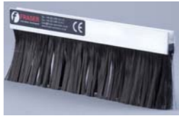
ION-101 Cepillo antiestático anclaje frontal

Gran rendimiento con una inigualable relación coste, eficacia y versatilidad. Ideales para altas velocidades y grandes cargas.