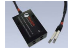
ION-SC Conector Box 2:1 De 1 a 2 barras ION-SC Conector Box 4:1 De 1 a 4 barras

Amplían la capacidad de conexión del controlador Ionstorm hasta cuatro barras. Instalación fácil y rápida. Opciones disponibles: 2:1 y 4:1