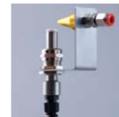
ION-4200 Boquilla de aire ionizado

Eliminador de estática de alto rendimiento, adecuado para neutralizar la carga estática y eliminar el polvo en objetos pequeños. El equipo transporta aire ionizado a alta velocidad hacia el objeto. La ionización elimina la carga estática permitiendo que el polvo pierda su adherencia al objeto de forma que el aire se lo lleve. Posibilidad de instalar varias boquillas con barra ionizadora.