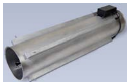
ION-6000 Tubo antielectrostático aire ionizado

Equipo diseñado para incorporarlo en sistemas de transporte neumático y neutralizar la electricidad estática generada en este proceso. Mejora drásticamente la eficiencia de la separación del polvo del producto en los ciclones, elimina la electricidad estática, elimina la acumulación de carga en tolvas, evita la adhesión de material en las paredes del conducto y evita atascos.