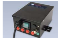
ION-HP80 Unidad de potencia 8kV 4 salidas

Unidad de potencia diseñada para alimentar las barras ionizadoras ION-1250S80 de alto rendimiento.