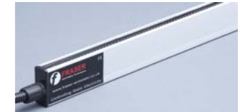
ION-7080 Para ION-7330 y ION-7324 ION-7081 Para ION-7333, ION-7360 y ION-73150

Aplican la carga estática de forma segura, controlable, fiable y rentable en aplicaciones industriales que precisen adhesión temporal. Ofrece una productividad sin igual en aplicaciones de fijando de láminas y films de plástico, fabricación de bolsas, máquinas envolventoras y otras áreas de la adhesión temporal.