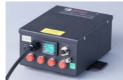
ION-HP50 Unidad de potencia 4 salidas ION-HP50-1 Unidad de potencia 1 salida ION-HP50-2 Unidad de potencia 2 salidas ION-HP50-F Unidad 4 salidas max potencia

Suministra la energía necesaria para el correcto funcionamiento de los últimos eliminadores de estática de alto rendimiento. Ofrecen muchas ventajas para el fabricante internacional. Produce alta tensión y baja corriente de una manera controlada y segura para los equipos que trabajan a 5.5kV - 6kV.