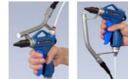
ION-4125T Entrada aire superior

Pistola de aire ionizado ultra potente, capaz de neutralizar la electricidad estática y eliminar el polvo y otros contaminantes. Disponible con alimentación de aire superior o inferior, para adaptarse a todas las necesidades.