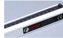
ION-1250 Barra eliminadora pernos fijos

Su potente rendimiento y fiabilidad hacen que esta barra sea la primera elección en eliminadores electrostáticos para los principales fabricantes.