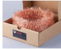
ION-801 Eliminador inductivo tipo Guirnalda

Método tradicional y efectivo para eliminar la electricidad estática.