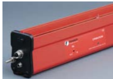
ION-3100 Barra Jupiter alcance 1,5m sin aire

Avanzado sistema de control de estática de largo alcance. Utiliza la tecnología de ionización inteligente para proporcionar un rendimiento de neutralización estática sin igual, de una manera segura y fiable a distancias de hasta 1,5 m. Neutralización electrostática hasta 5 veces más potente que los principales competidores.