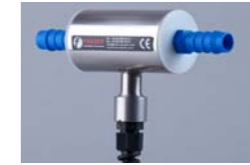
ION-4300 Boquilla de aire ionizado en línea

Boquilla de aire comprimido ionizado para instalar en suministros de aire comprimido existentes. Se instala usando el sistema de aire comprimido estándar para eliminar los contaminantes electrostáticos o en sistemas de separación de aire montados en las cubiertas de alimentación de hojas.