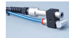
ION-4400 Boquilla de aire ionizado ancho

Eficaz chorro de aire ionizado compacto que incorpora un punto ionizante ION-1260 y una boquilla de aire patentada, montado todo en un bloque de metal. Ideal para limpiar y neutralizar la carga estática en productos pequeños. También se utiliza para la separación de hojas, donde su corriente de aire delgada pero ancha es eficaz en la separación de las hojas y la neutralización de su carga estática.