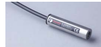
ION-HPILC Conector extensión cable HV

Permite tener un punto de desconexión del cable de alta tensión en cualquier punto de la instalación. También se puede utilizar para alargar los cables existentes.