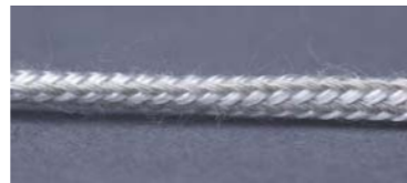
ION-850 Cordón antiestático

Cordón 100% de filamentos de microfibras conductivas. Método nuevo y efectivo de eliminar la electricidad estática. Solución económica para utilizar en aplicaciones donde el coste de un eliminador eléctrico no se justifica.