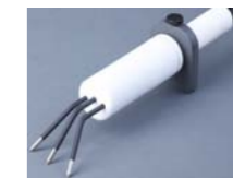
ION-7093 Electrodo 3 puntos

Electrodo de alto rendimiento diseñado para fijar los bordes del film de forma precisa. Aplica la carga electroestática exactamente en el punto deseado.