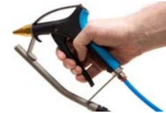
ION-4110 Pistola aire ionizado

Pistola de aire ionizado de alta resistencia, diseñada para neutralizar la electricidad estática y eliminar el polvo y otros contaminantes. Se utiliza para limpiar las molduras, láminas de plástico, automóviles, etc - donde el polvo y la estática son un problema.