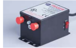
ION-9055-2 Unidad de potencia compacta

Diseño compacto que permite alimentar hasta dos eliminadores de electricidad estática. Suministra la alta tensión que produce la ionización en Barras, Sopladores, pistolas, etc