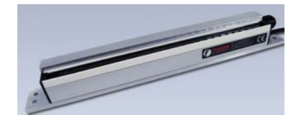
ION-1250AB Barra eliminadora con Airboost

Utiliza el aire comprimido a baja presión para extender la efectividad de la neutralización de la barra ION-1250S hasta los 500mm.