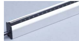
ION-1250S80 Barra antistática alto rendimiento

Barra de 8kV, diseñada para eliminar la electricidad estática en aplicaciones de elevada carga y gran velocidad.