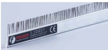
ION-660 Eliminador electricidad estática

Eliminador de electricidad estática compacto, utilizado en innumerables tipos de máquinas como: manipulación papel, embalaje, etiquetado, codificación e impresión. Simple y eficaz, de bajo coste y versátil.