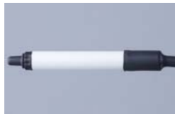
ION-3810 Punto ionizador Ionstorm

Se pueden utilizar en pares para la neutralización bi-polar, o por separado para la neutralización uni-polar. Su reducido tamaño permite utilizar la tecnología DC en diferentes aplicaciones.