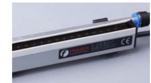
ION-1250Air Barra eliminadora con aire

Utiliza el aire comprimido a baja presión para extender la efectividad de la neutralización de la barra ION-1250S hasta los 500mm.