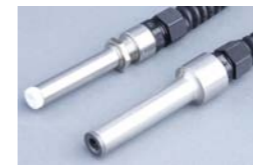
ION-1260 Punto ionizador

ideal para neutralizar la carga electrostática en pequeños objetos y espacios reducidos.