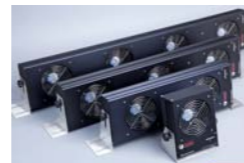
ION-2050 Soplador aire ionizado 1 ventilador

Ionizador de altas prestaciones con fuente de alimentación y controles integrados. Alto rendimiento para satisfacer los exigentes requisitos de la industria electrónica, médica, farmacéutica y RFID.