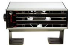
ION-2010 Soplador de aire ionizado

Eliminador de electricidad estática de larga distancia y excelente rendimiento de ionización gracias al gran volumen de aire generado. Construcción robusta de acero inoxidable.