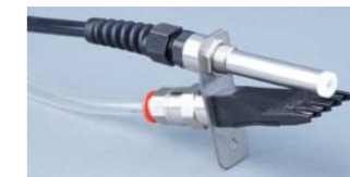
ION-4510 Boquilla de aire ionizado plano

Chorro de aire ionizado plano y rápido para neutralizar la electricidad estática y limpiar. Util para la neutralización estática de larga distancia, separación de hojas, eliminación de polvo y limpieza.