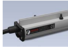
ION-3850SC Barra ionizadora Ionstorm

Tecnología de impulsos DC para la neutralización de electricidad estática a largas distancias sin ayuda de aire. Optimo rendimiento desde 200mm hasta 1m.