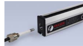
ION-1255 Barra con cable reemplazable

Versión de la barra ION-1250S pero con conector que permite conectar y desconectar el cable para poderlo reemplazar fácilmente.