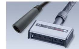
ION-7090 Electrodo cilíndrico ION-7095 Electrodo plano

Dos tipos disponibles de electrodos generadores de electricidad estática para la carga de áreas pequeñas. Ideales para la fijación de los bordes de films en bobinadoras, IML y cualquier aplicación que requiera la adhesión temporal de dos materiales.