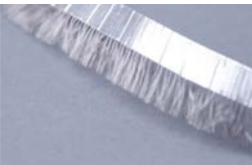
ION-406/7 Filamentos 7 mm y cinta 6 mm.

Potente cinta de cepillo antiestático fácil de usar e instalar. Está provista de una parte adhesiva que facilita la instalación.